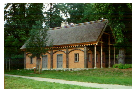
Das Waschhaus (erbaut um 1820)

Das Dorf Petzow ist bereits im Jahre 1929 Teil der Stadt Werder geworden. Petzow selbst wurde erstmalig im Jahre 1419 urkundlich erwähnt, seine Geschichte geht aber viel weiter zurück. Der Ortsname Petzow ist auf die Frühansiedlung wendischer Slawen in der Gegend, die Entstehung der Dörfer zurückzuführen und ist vom slawischen/altpolabischen „Petsch“ abzuleiten, was sw. Ofen Feuerstelle bedeutet und schon auf einen frühen Abbau des hier lagernden Tons und seine Verarbeitung, sein Brennen zu Ziegeln, hinweist. 1