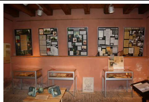
Ortsgeschichtlicher Teil, 2009

Zunächst gibt es den Teil zur Ortsgeschichte . Hier werden die Besucher über Schautafeln zur Ortsgeschichte von der ersten urkundlichen Erwähnung, der Geschichte der Familie Kaehne und der Entwicklung des Ortes in verschiedenen Zeitepochen bis hin zur