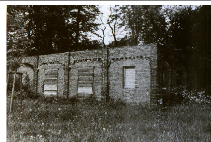
Das Waschhaus vor der Restaurierung

Im Jahr 2000 wurden die ersten musealen Gegenstände in das Haus gebracht und im Jahr 2001 wurde es als Museum eröffnet. Auf der Grundlage eines Kooperationsvertrages mit dem Ortsbeirat wird das Museum seit Jahren durch den Heimatverein Petzow e.V. betreut. Das Museum ist in den Sommermonaten immer sonntags geöffnet, es verzeichnete im Jahr 2009 1650 Besucher. Schon früh war man sich der Bedeutung der Präsentation von Teilen der Ausstellung auch im Internet bewußt und so gibt es seit 2004 die Internetseite des Heimatvereins www.petzow-online.de , die auch Auskunft über das Museum gibt. Die Internetseite wird täglich von etwa 30 Usern benutzt.