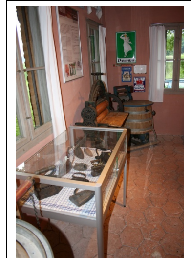
Ausstellung zur Geschichte der Waschkultur, Detail, 2009

Auf hoch qualitativen Kunstdrucken in ansprechender Rahmung kommt man hier z.B. mit den Werken von Max Liebermann, Henri Toulouse Lautrec oder Vincent van Gogh im wahrsten Sinne des Wortes auf Tuchfühlung. Die Gestaltung der Ausstellung wurde aus Mittel des Heimatvereins realisiert, der in der glücklichen Lage war, auf Mittel aus einer Großspende zurückgreifen zu können. Die Kosten betragen ca. 4.000 Euro, die Konzeptions- und Entwicklungsleistungen wurden ehrenamtlich erbracht.