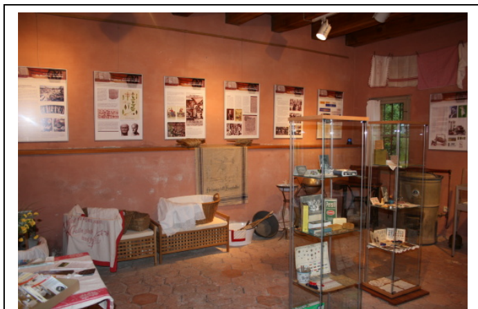
Ausstellung zur Geschichte der Waschkultur, 2009

Seit dieser Teil der Ausstellung neu gestaltet wurde, ist er von den Besuchern nicht nur mit viel Begeisterung aufgenommen, sondern auch von Fachleuten (Biologen, Chemiker, Physiker, Historiker, Kunstwissenschaftler) mit viel Anerkennung bedacht worden.