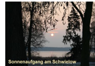
Sonnenaufgang am Schwielow

Einflüsse bekannter Baumeister prägen wesentlich die Architektur in dem kleinen Ort. Hinzu kam im 19. Jahrhundert das Zusammentreffen glücklicher Umstände, die Petzow zu seinem